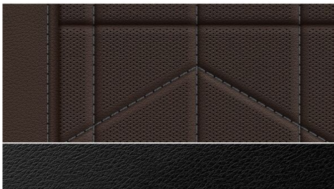
BMW Individual leather 'Merino' Individual leather 0,00 € VDMY