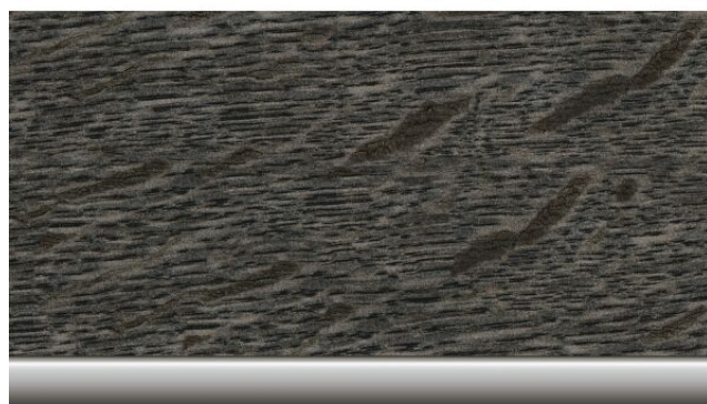
Unutrašnja lajsna visokog sjaja 'Oak-mirror finish' 0,00 € 43D