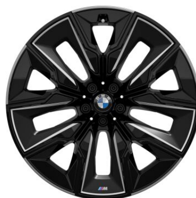
3D polirane M aerodinamične felne 21" 0,00 € 1FD